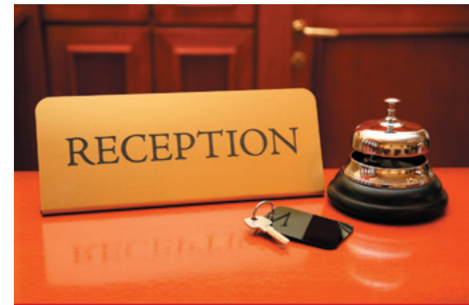
Гостиницы: все есть, но чего-то не хватает...

Невский проспект, д. 65, лит. А, помещение 11-Н +7 (812) 677 91 65