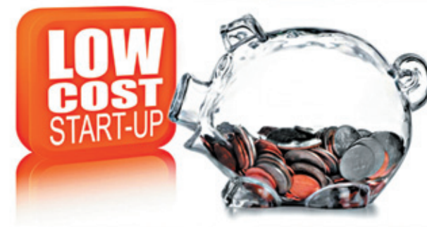
Встречи и расставания с low cost...