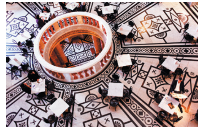
Вена – комфорт и обаяние «Веселого города»