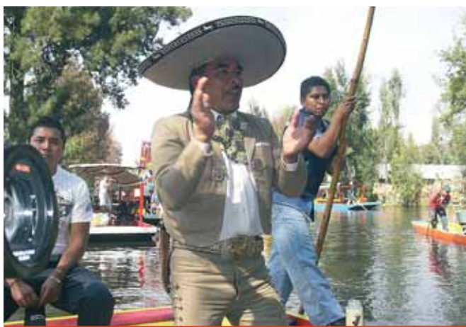
С чего начинается Мексика...