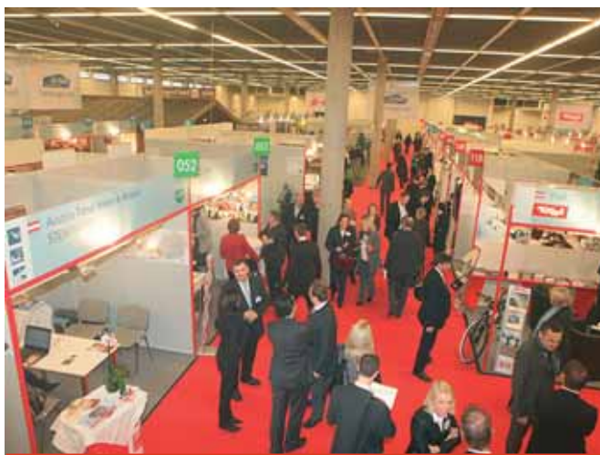
Австрийская actb в новом оформлении