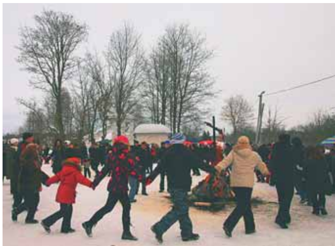
Псковская масленица: «нет» низкому сезону!